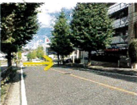
ファミリーマートの先の 信号を右へ