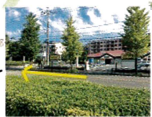
北口を出たら、Odakyu OX の前を左へ