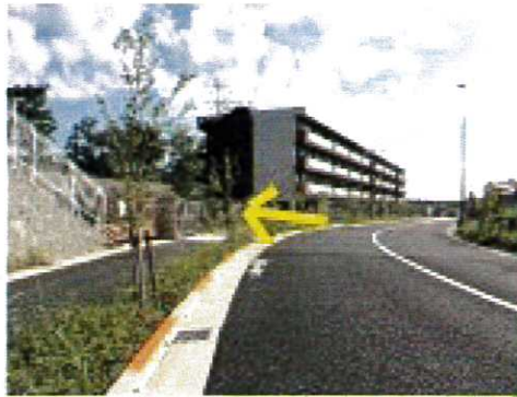
学生寮の手前の門から 入場します。