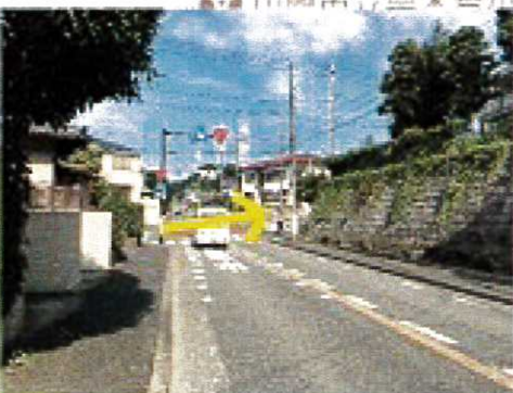
信号のない交差点を右へ