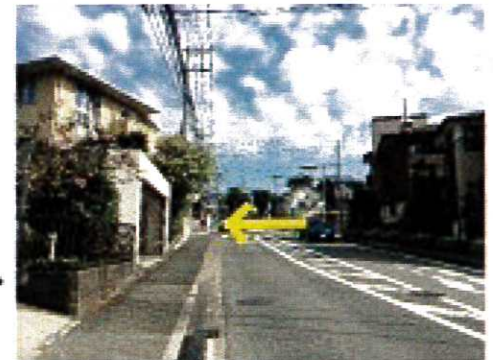
2つ目の信号を左へ