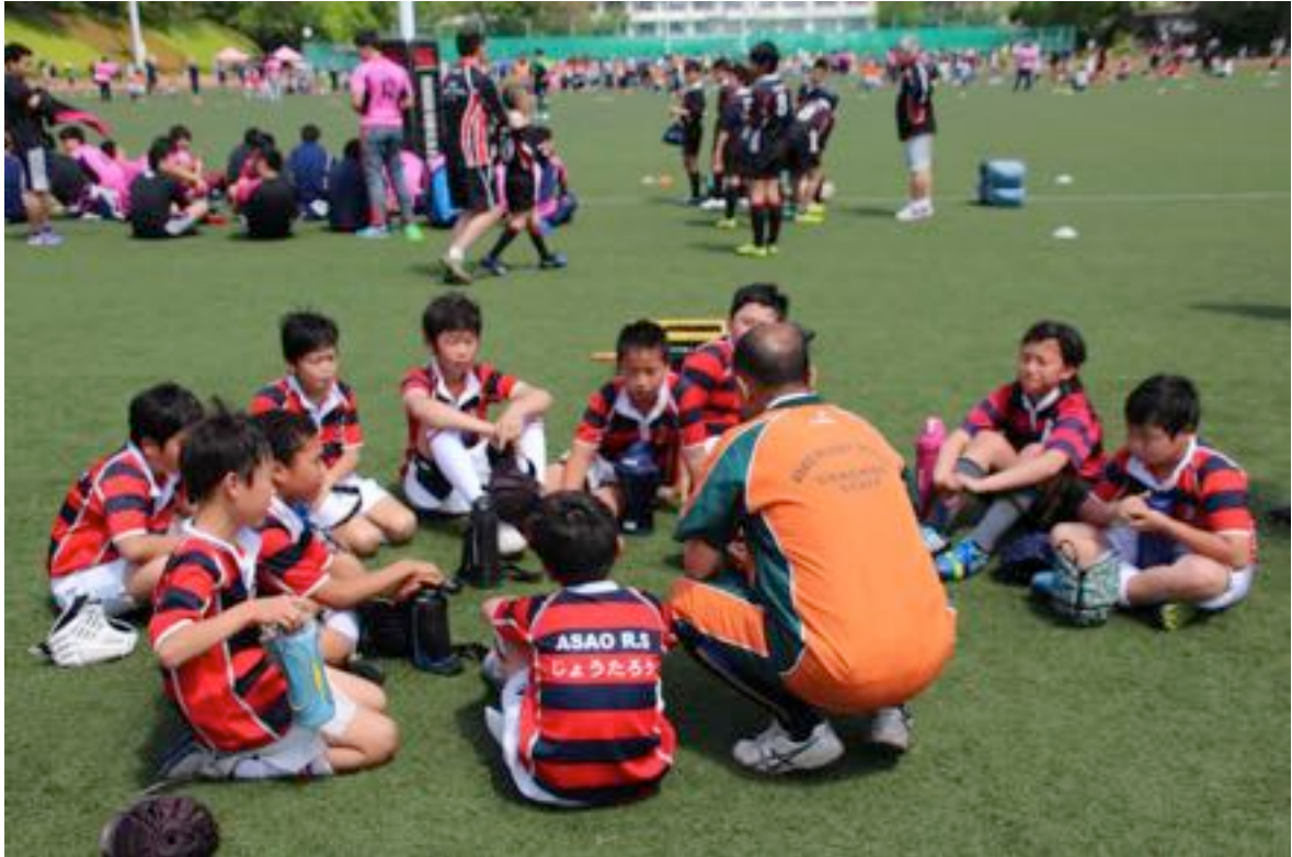
日大フェスタにて