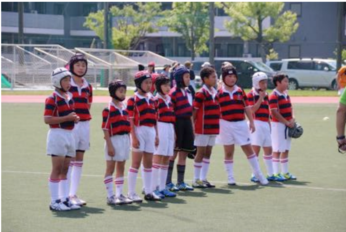
日大フェスタにて

みなさんはじめまして。1年、5年で息子と娘がお世話になっております。なかなか普段は、グラウンドに足を運ぶことができませんが、これからは、できる限りグラウンドで、頑張っている姿を応援しに行かせていただきたいと思います。至らぬ点、多々あるとは思いますが、ご指導いただければ幸いです。ラグビーが大好きな子供たちに負けず劣らず、トレーニングしてみようかな？と始めた懸垂ですが…。まだ、1度もできず(+_) しばらく、あきらめず、頑張ってみようと思います。よく、「努力は必ず報われる」と耳にします。子供たちよ！かーちゃんの姿を見てね！コーチの皆様、保護者の皆様、選手の皆様、どうぞよろしくお願いいたします。