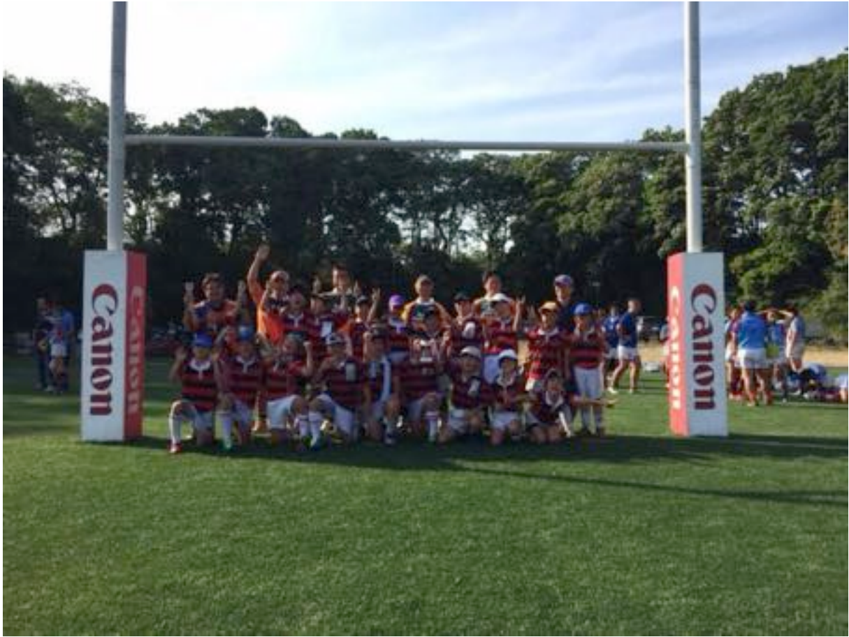
キヤノンカップ2017優勝！ 2017/5/21